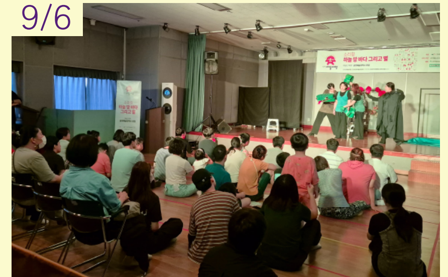
2024년 1차 문화기획행사 '하늘, 땅, 바다 그리고 별(리듬과 화음)' 소리컬