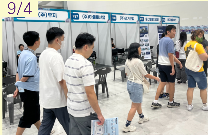
직업적응훈련반 5차 직업탐색 '스마트산업 장애인 취업박람회 참여'