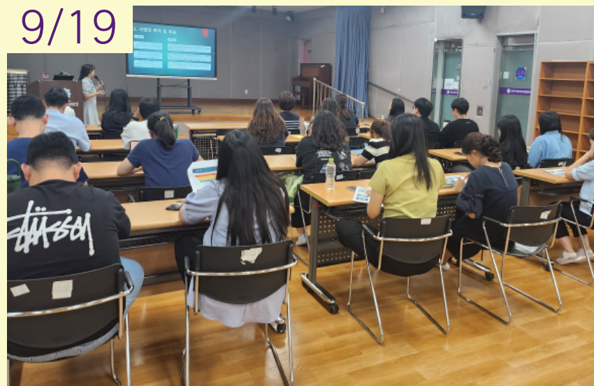
사람중심실천위원회 전문가교육 '사람중심실천과 개인예산제'