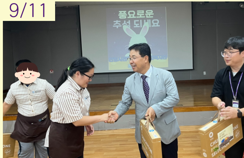
직업지원팀 추석명절선물 전달식