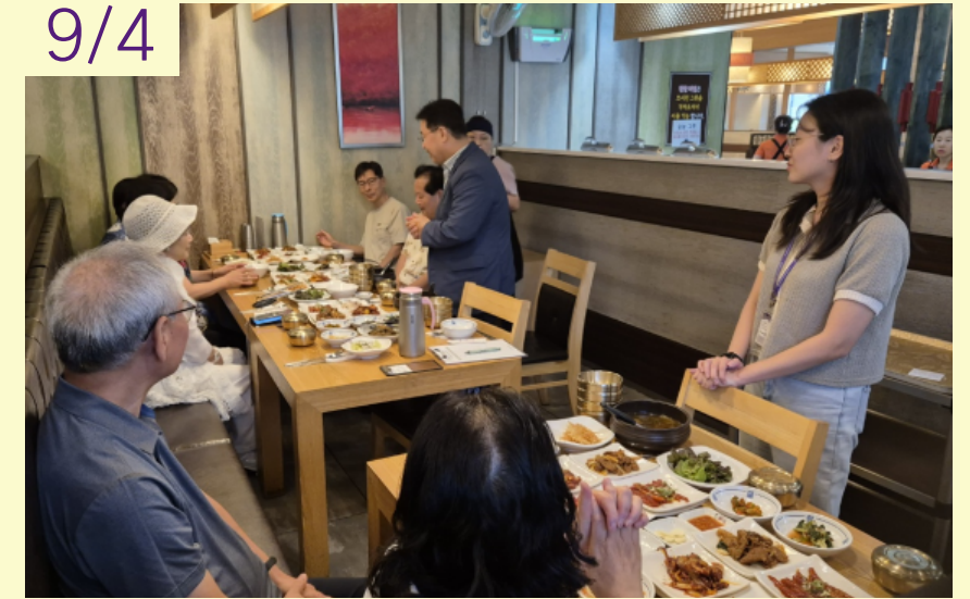
2차 자원봉사자 역량강화 및 지지격려 (안양사랑나눔 상록자원봉사단)