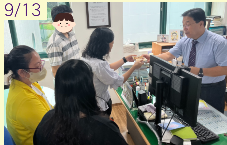
직업지원팀 훈련파트 일상생활훈련 '추석맞이 명절인사 및 안부 나눔'