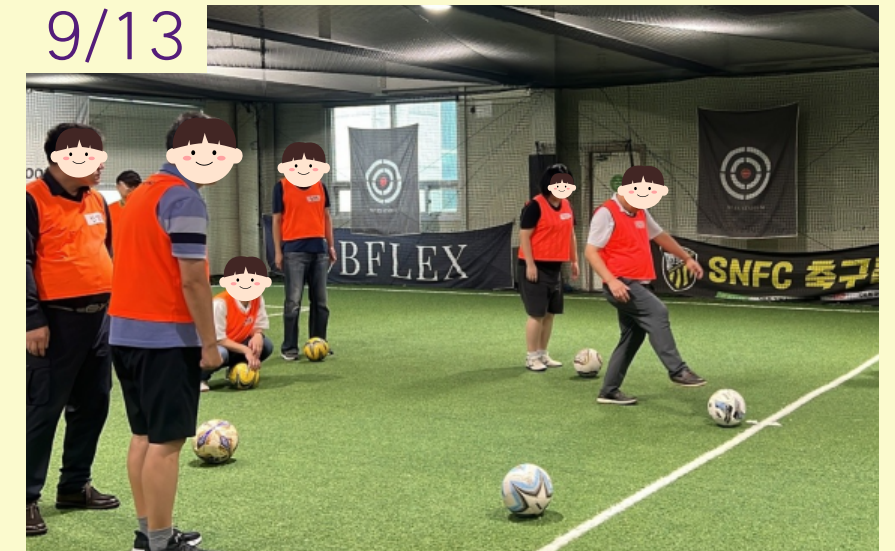
2차년도 세심(洗心) 1차 밖에서 힐링(풋살)