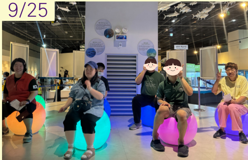
작업활동2반 6차 지역사회적응훈련 '외부식당&과천과학관 이용'