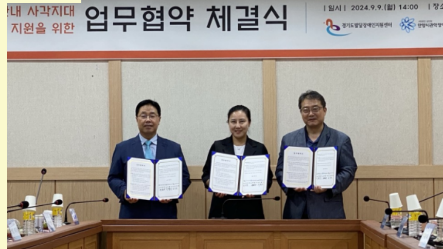
안양시 관내 사각지대 발달장애인 지원을 위한 업무협약 체결