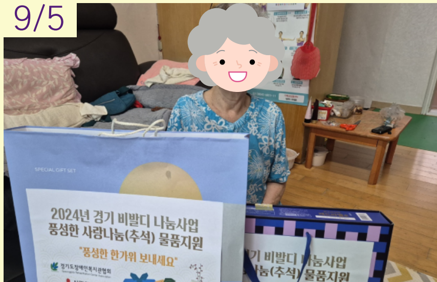
2024년 경기비발디 나눔사업 풍성한 사랑나눔(추석) 물품지원