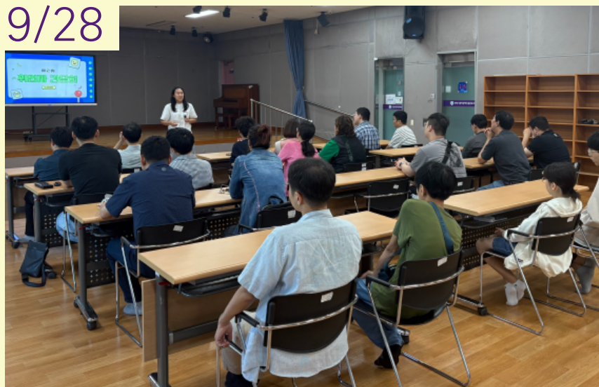
2024년 2차 취업자 간담회