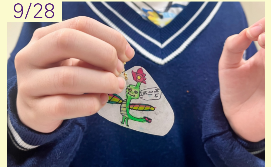
장애 아동·청소년 취미여가활동지원 하루배움 - 슈링클스만들기