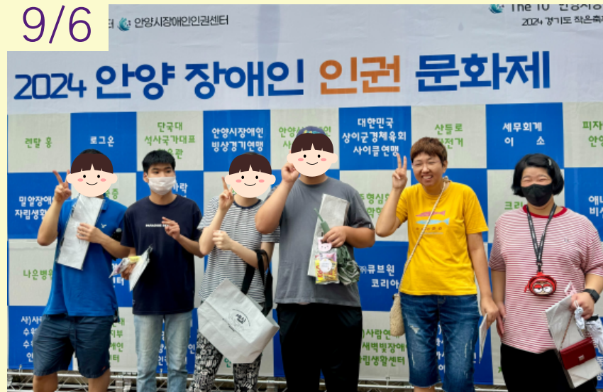
작업활동2반 7차 일상생활훈련 '대중교통 이용하기'