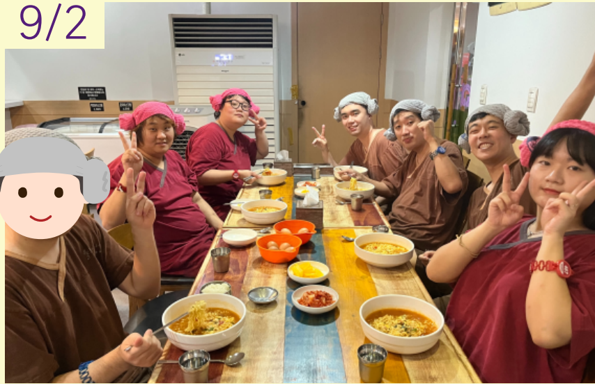
직업적응훈련반 10차 지역사회적응훈련 '샤우나 다녀오기'