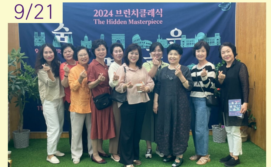
활동지원기관 하반기 여가문화활동 '낭만이 있는 가을 음악회'