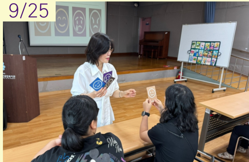
2024년 2차 인권교육 "나"를 지키는 "나"